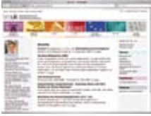
Oficijelna web-stranica Ministarstva za obrazovanje www.bmukk.gv.at