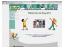
Pokret i sport www.bewegung.ac.at