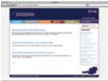
Savjetovalište za naobrazbu službe školske psihologije www.schulpsychologie.at