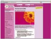
Fer – škola www.faireschule.at