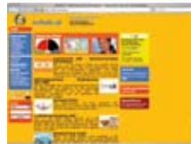
Školski portal www.schule.at