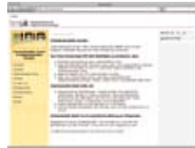
Interkulturno učenje http://ikl.bmukk.gv.at/