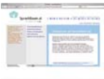
Rano poticanje jezika www.sprachbaum.at