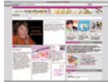
Umreženost kod čitanja www.lesenetzwerk.at