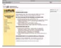
Kültürler arası öğrenme http://ikl.bmukk.gv.at/