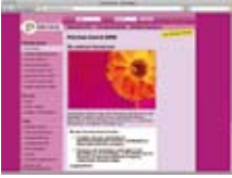
Adil okul www.faireschule.at