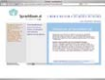
Erken dil öğrenme desteđi www.sprachbaum.at