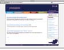
Okul psikolojisi-Eđitim danıřmanlıđı www.schulpsychologie.at