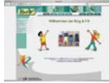
Hareket ve spor www.bewegung.ac.at