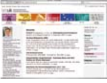
Ders Bakanlıđı'nın resmi internet sayfası www.bmukk.gv.at