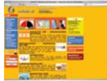
Okul portalı www.schule.at