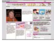
Okuma ađı www.lesenetzwerk.at