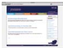
Школьная психологическая консультация по вопросам обучения www.schulpsychologie.at