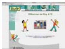
Движение и спорт www.bewegung.ac.at