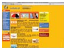
Школьный портал www.schule.at