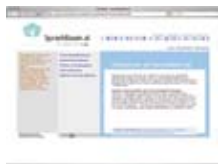
Раннее языковое развитие www.sprachbaum.at