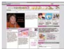
Сеть для чтения www.lesenetzwirk.at