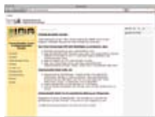
Межкультурное обучение http://ikl.bmukk.gv.at/