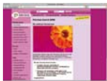
Правильная школа www.faireschule.at