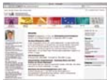
Официальный вебсайт министерства обучения www.bmukk.gv.at