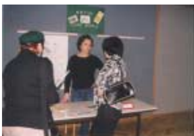
Junet (Ibis acam)